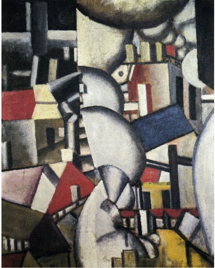
Fernand Léger, Smoke, 1912