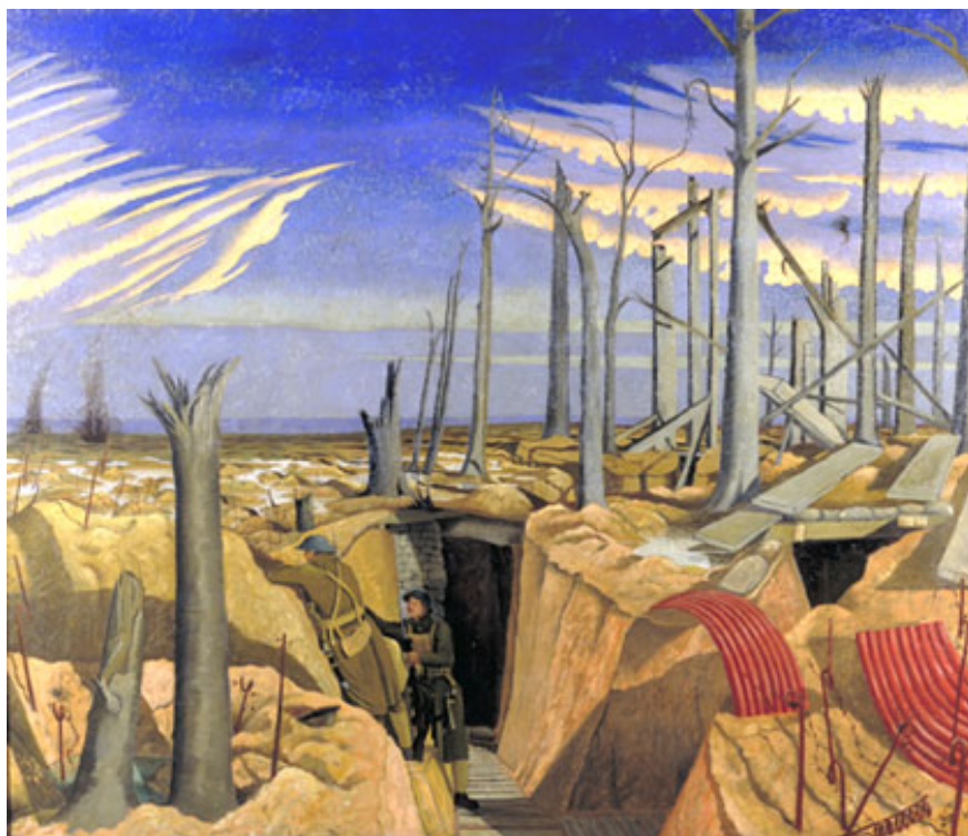
John Nash, Oppy Wood, 1918