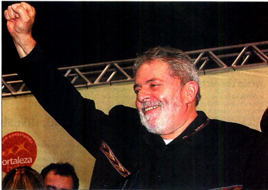
LULA EM evento em Fortaleza: presidente comemora oferta de crédito de quase R$ 1,5 trilhão em seu governo

o resultado é fruto das políticas de governo. Isso deu uma resposta extraordinária.