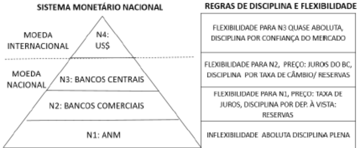
Figura 1 – Pirâmide Monetária Minskyana