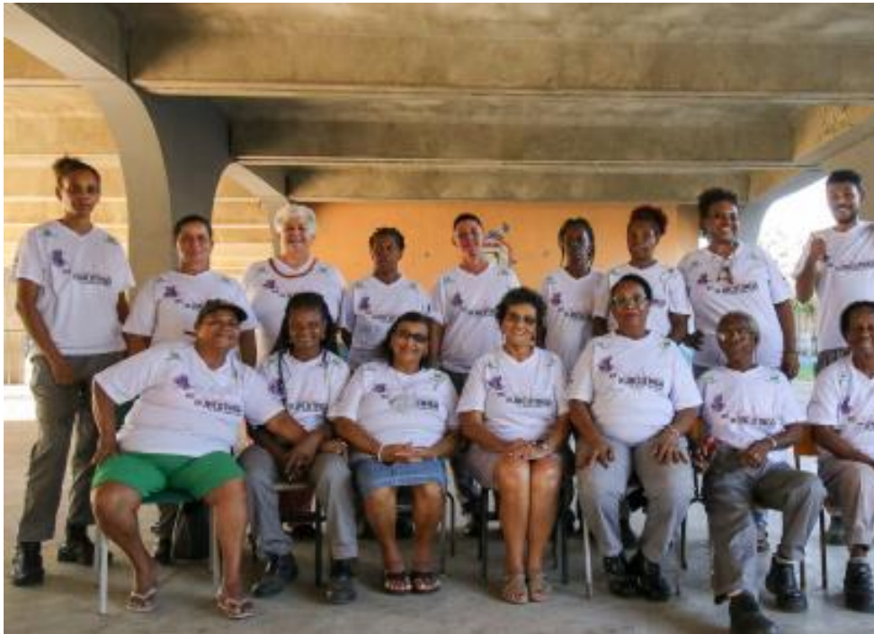
Grupo de Cooperativas COOPCARMO.