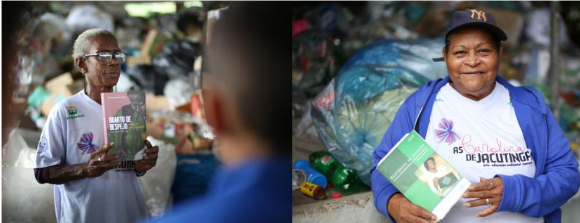
Algumas cooperativadas com seus exemplares do livro “Quarto de Despejo” de Carolina de Jesus.

A investigação acerca da contribuição socioambiental das cooperativas de reciclagem no contexto do pós-consumo revelou, por meio de pesquisa documental e observação direta — especialmente em diálogo com um grupo de mulheres cooperadas —, evidências claras do papel estratégico que essas organizações desempenham na gestão reversa dos resíduos sólidos urbanos.